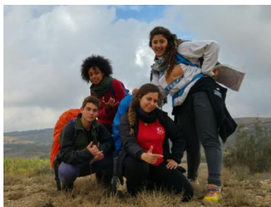
סדרת ניווט סדרת ניווט