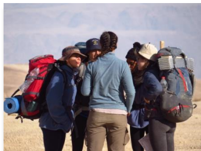
סדרת סיירות סדרת חוסן