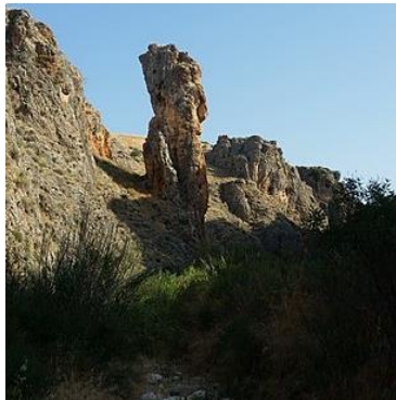
נחל עמוד

במהלך חודש אוקטובר יצאה קבוצה של 30 חניכים ממכינה קד"צ למסע שטח ראשון, שכלל שלושה ימים ושני לילות בשטח. האירוע התרחש ביום השני למסע, בו אושר למכינה לבצע מסע מנחל עמוד עליון עד חניון הפיתול (המחשת המסלול במפה פה). במהלך המסלול ביום השני, המע"ר לא חש בטוב, והראה סימני התייבשות החל מ-9:00. בשעה 11:00 המע"ר חש כי אינו יכול להמשיך, ודיווח על כאבי ראש, בחילות והקאה. לכן, נשאר המע"ר מאחור עם איש צוות. במקביל, הקבוצה המשיכה במסע וסיימה כמתוכנן.