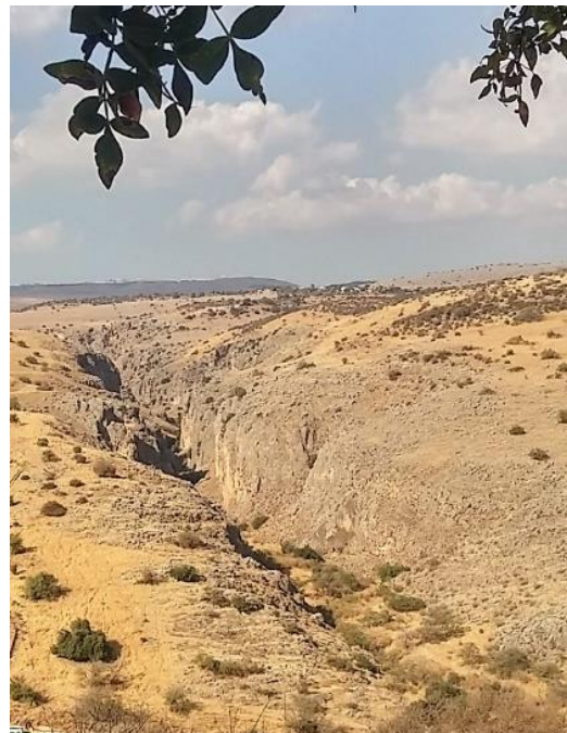
נחל עמוד תחתון - אוקטובר